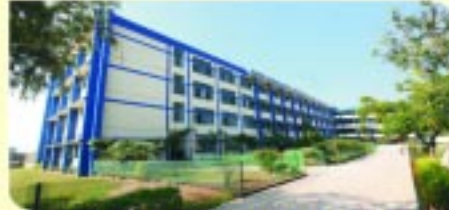
ਗੁਰੂ ਗੋਬਿੰਦ ਸਿੰਘ ਵਿਦਿਆ ਮੰਦਰ ਸੀ. ਸੀ. ਸਕੂਲ