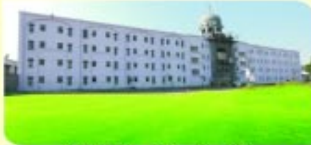
ਦਰਬਨੀ ਡਿਊਟੀ ਅਤੇ ਰਿਹਾਇਸ਼ੀ ਇਮਾਰਤ