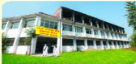
ਮਾਤਾ ਸਾਹਿਬ ਕੌਰ ਸਿਲਾਈ ਸੈਂਟਰ