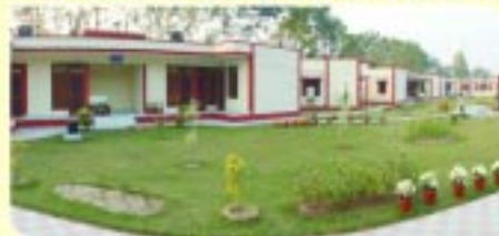
ਅਕਾਲ ਬਿਰਧ ਆਸ਼ਰਮ