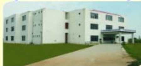
ਸੰਤ ਵਰਿਆਮ ਸਿੰਘ ਮੈਮੋਰੀਅਲ ਪਬਲਿਕ ਸੀ. ਸੀ. ਸਕੂਲ