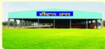
ਸਾਲਾਨਾ ਸਮਾਗਮ ਦੀਵਾਨ ਹਾਲ