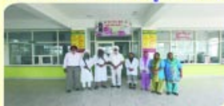
ਸੰਤ ਵਰਿਆਮ ਸਿੰਘ ਚੈਰੀਟੇਬਲ ਹਸਪਤਾਲ