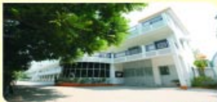
ਇੰਟਰਨੈਸ਼ਨਲ ਡੀਵਾਇਨ ਕਾਲਜ ਆਫ ਐਜੂਕੇਸ਼ਨ (ਬੀ.ਐੱਫ.)