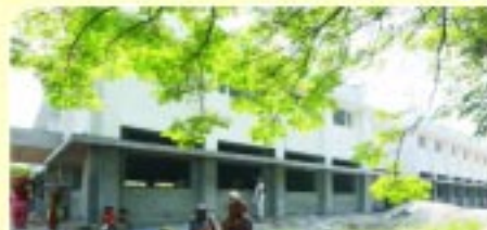
ਮਾਤਾ ਰਣਜੀਤ ਕੌਰ ਕਾਲਜ ਆਫ ਨਰਸਿੰਗ